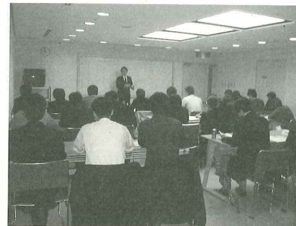
写真1 セミナー風景

加えて2008年秋より民・民での連携体制の実現に力を入れている。根岸社長は、「日